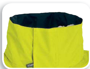
Collo foderato pile