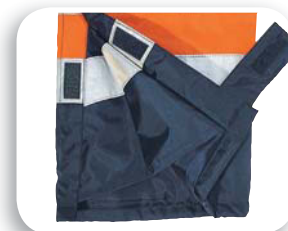
Parte bassa con soffietto d'agiatezza