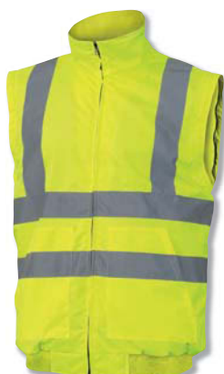
Giubbotto senza maniche