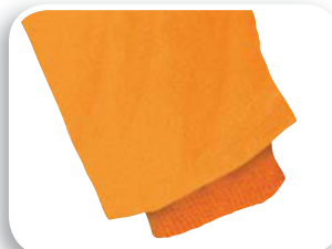
Polsini interni bordo a coste